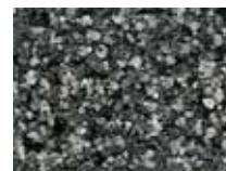
PFL – базальт EAN -57792 4

В ходе печати допускаются отклонения оттенков на изображениях.