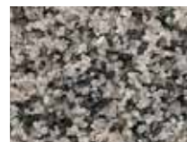
PFL – каменно-серый EAN -57791 7