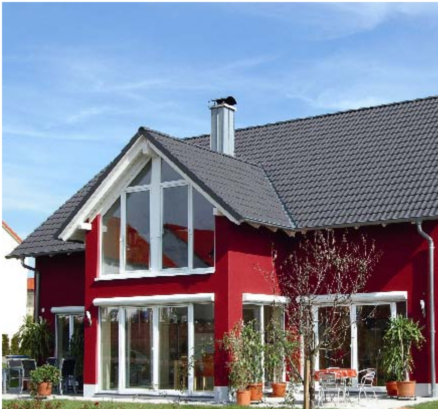
Bildzeile: Neben weiß und dezenten Pastelltönen kommen auch kräftige Farbtöne bei der Fassadengestaltung zum Einsatz.