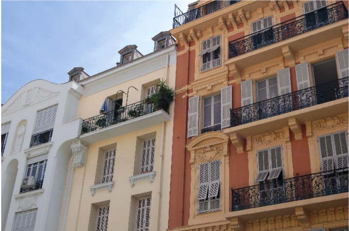
Bildzeile: Bestehende Bausubstanz in neuem Glanz: Die farbliche Neugestaltung der Fassade verleiht dem Gebäude ein ausdrucksvolles Erscheinungsbild im Einklang mit der Nachbarschaft.