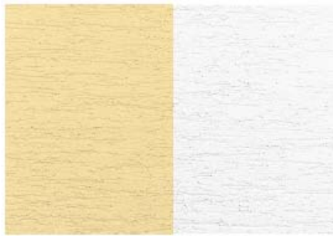
Rillen- und Reibeputzstruktur