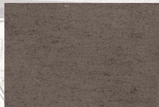
NSR 0,4 420 dunkelgrün