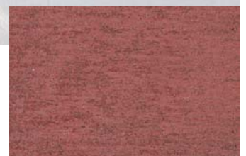
NSR 0,4 530 rotbraun

Durch Drucktechnik und die verwendeten Naturrohstoffe können Farbschwankungen auftreten. Bei Nachbestellung sind geringfügige Farbabweichungen nicht auszuschließen. Für eine absolute Farbgleichheit zwischen dem vorliegenden Farbmuster und dem NSR 0,4 kann daher keine Gewähr übernommen werden. Änderungen im Rahmen der Weiterentwicklung vorbehalten.