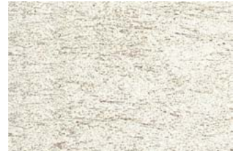
NSR 0,4 210 hellgrau