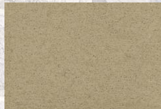
NSR 0,4 400 hellgrün