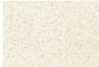
NSR 0,4 200 naturweiß