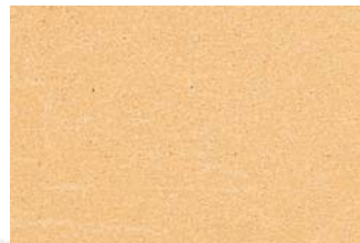
NSR 0,4 300 gelb