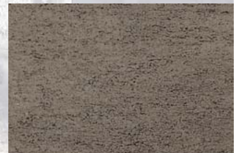
NSR 0,4 410 grün