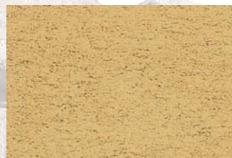
NSR 0,4 320 hellocker