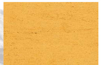
NSR 0,4 340 ocker