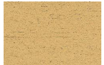
NSR 0,4 310 gelbgrün