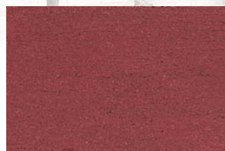
NSR 0,4 510 dunkelrot