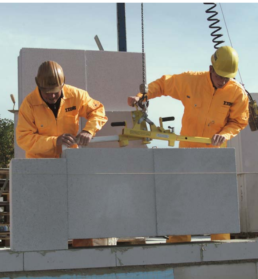
Rasches Versetzen der Ytong®-Porenbetonbauteile per Kran spart Zeit und Geld